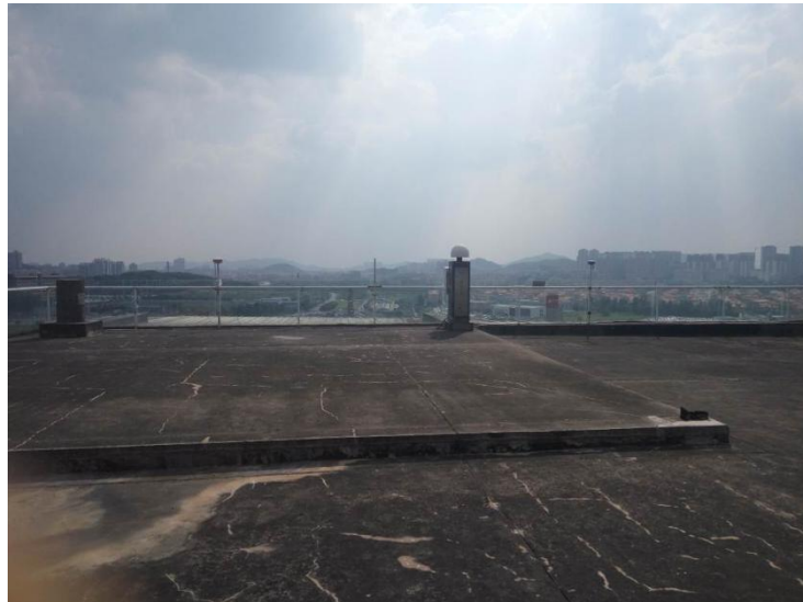
图 3 RTK 定位精度测试环境

PPK 定位精度，采用同 RTK 定位类似的方法，但机载 GNSS 接收机和参考站接收机独立接收卫星信号，无须进行差分数据传输。数据经过后处理软件进行统计分析，PPK 定位精度满足如下要求：